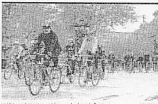
►► Únicos participantes pedalean por la plaza de Catalunya.