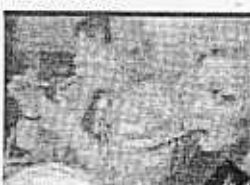
►► Dos concursantes.