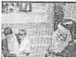
►► Adorno navideño, en Mercabarna.